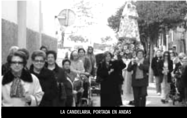
LA CANDELARIA, PORTADA EN ANDAS

Febrero nos trajo la festividad de la Candelaria (el día 2), que conmemora la presentación de Jesús en el Templo. Siguiendo esta tradición, muchos bebés nacidos en el último año participaron en la procesión de las candelas y, después de la misa, fueron presentados a la Patrona de Pinoso.