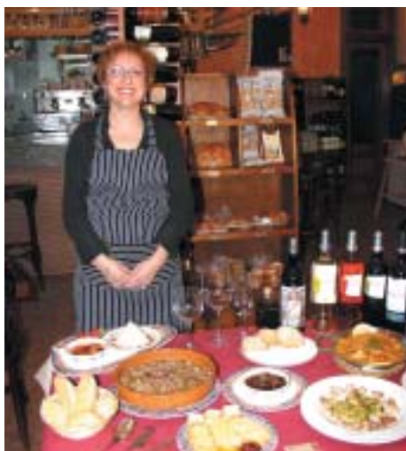
LOS RESTAURADORES SE ESMERARON EN LA PRESENTACIÓN DE SUS PLATOS Y OFRECERON LO MEJOR DE SU COCINA