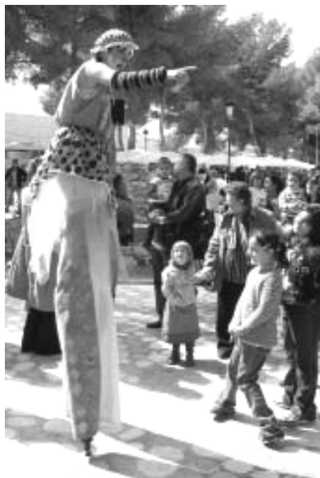
ANIMACIÓN EN LA IV EDICIÓN DE LA FERIA DEL MUJER

Quedan poco días para la cita, tiempo suficiente para dejar en nuestra agenda un hueco para poder asistir a la V Feria de la Mujer Empresaria y Emprendedora, un evento que ya se ha instaurado en el calendario de acontecimientos sociales de nuestro municipio. Por ello, también se aprovechará para promocionar el centenario de la Feria y Fiestas.