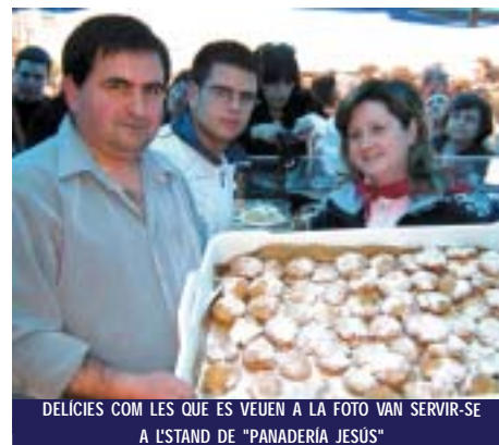
DELÍCIES COM LES QUE ES VEUEN A LA FOTO VAN SERVIR-SE A L'STAND DE "PANADERIA JESÚS"