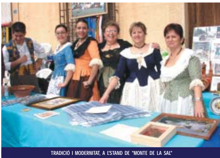
TRADICIÓ I MODERNITAT, A L'STAND DE "MONTE DE LA SAL"