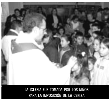
LA IGLESIA FUE TOMADA POR LOS NIÑOS PARA LA IMPOSICIÓN DE LA CENIZA

Tras los excesos del Carnaval, el 1 de marzo llegaba el tiempo de privaciones que es la Cuaresma, y que comenzó con la imposición de la Ceniza, que nos recuerda que nuestra vida en la tierra es pasajera. La Párroquia llevó a cabo dos imposiciones generales, por la mañana y la tarde, más la destinada a los niños y niñas de catequesis.