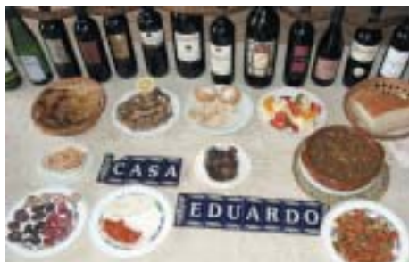
EL VINO DE NUESTRA TIERRA ES EL MEJOR ACOMPAÑANTE EN LA GASTRONOMÍA LOCAL