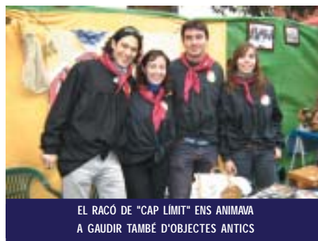
EL RACÓ DE "CAP LÍMIT" ENS ANIMAVA A GAUDIR TAMBÉ D'OBJECTES ANTICS