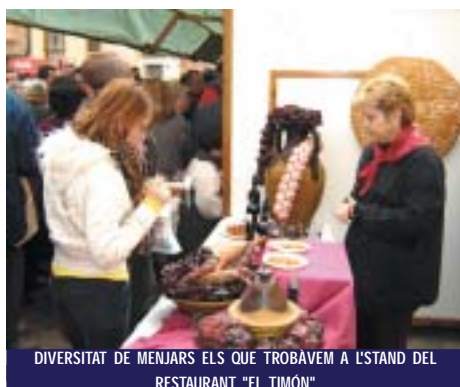
DIVERSITAT DE MENJARS ELS QUE TROBÀVEM A L'STAND DEL RESTAURANT "EL TIMÓN"