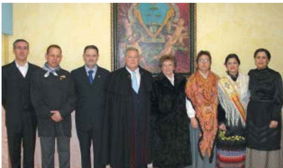
EL PREGONER, AMB LES AUTORITATS LOCALS, DAVANT L'ESCUT DEL PINÓS