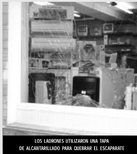
LOS LADRONES UTILIZARON UNA TAPA DE ALCANTARILLADO PARA QUEBRAR EL ESCAPARATE

Días después, en Alicante, era detenida una pareja de delincuentes, que habían cometido un delito de similares características en Novelda. La policía intuye que esta pareja, de 20 años de edad, pueda estar detrás de los últimos robos perpetrados con el mismo procedi-