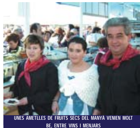
UNES AMETLLES DE FRUITS SECS DEL MANYÀ VENIEN MOLT BE, ENTRE VINS I MENJARS

A l'espai gastronòmic, des que van començar a repartir-se els primers bonus de degustació, als stands dels restaurants i comerços no van parar, tenint que repostar varies vegades. Això també es va notar