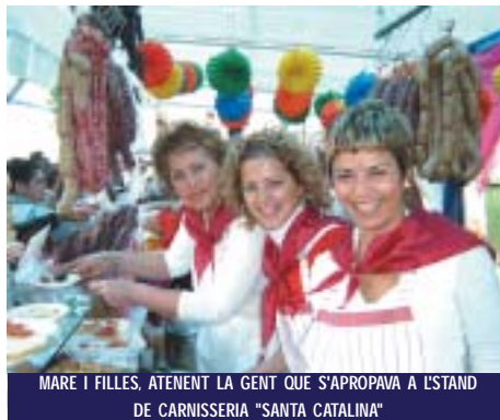
MARE I FILLES, ATENENT LA GENT QUE S'APROPAVA A L'STAND DE CARNISSERIA "SANTA CATALINA"