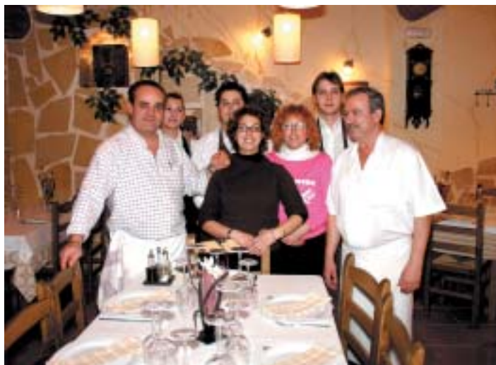
"LA COVA DEL GEGANT" PARTICIPÓ POR PRIMERA VEZ EN LA MOSTRA