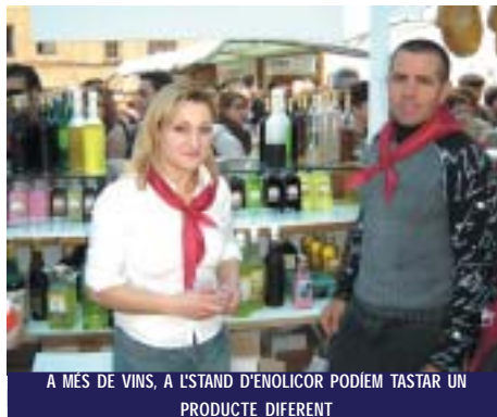
A MÉS DE VINS, A L'STAND D'ENOLICOR PODIEM TASTAR UN PRODUCTE DIFERENT