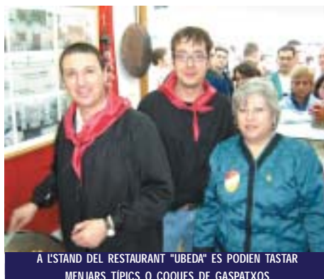
À L'STAND DEL RESTAURANT "UBEDA" ES PODIEN TASTAR MENJARS TÍPIC O COQUES DE GASPATXOS