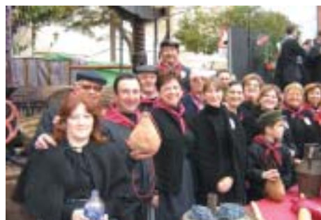
A L'STAND DELS "AMICS DEL VI" NO ES POT DIR QUE FALTARA GENT