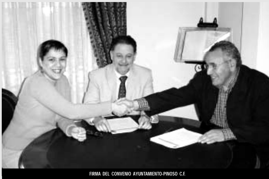
FIRMA DEL CONVENIO AYUNTAMIENTO-PINOSO C.F.

El convenio de 2006, supone una disminución de 60.000 euros en referencia al pasado año, con lo cual, la entidad ha saldado la deuda acumulada en los últimos años. Con esta aportación municipal, el Pinoso Club de Fútbol espera que, a partir de ahora, se evite generar nueva deuda. Para