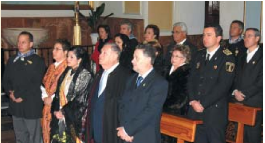
AUTORITATS I PREGONER, PRESIDINT LA MISSA DEL LLAURADOR

L'esforç fet per preparar la Mostra no es va aiguar. L'oratge va avançar la pluja a la nit anterior i els actes de la X Mostra del Pinós Antic van comptar amb l'oratge com millor aliat, deixant que es portaren a terme els actes programats i que les associacions pogueren mostrar les seues antiguitats als visitants.