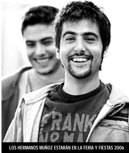
LOS HERMANOS MUÑOZ ESTARÁN EN LA FERIA Y FIESTAS 2006