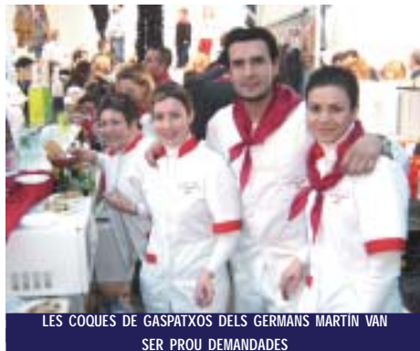
LES COQUES DE GASPATXOS DELS GERMANS MARTÍN VAN SER PROU DEMANDADES