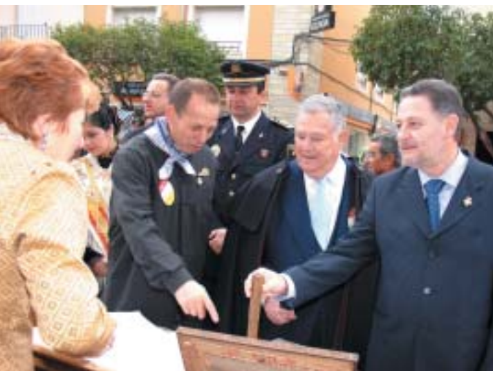
DESPRÉS DEL PREGÓ, VISITANT ELS STANDS