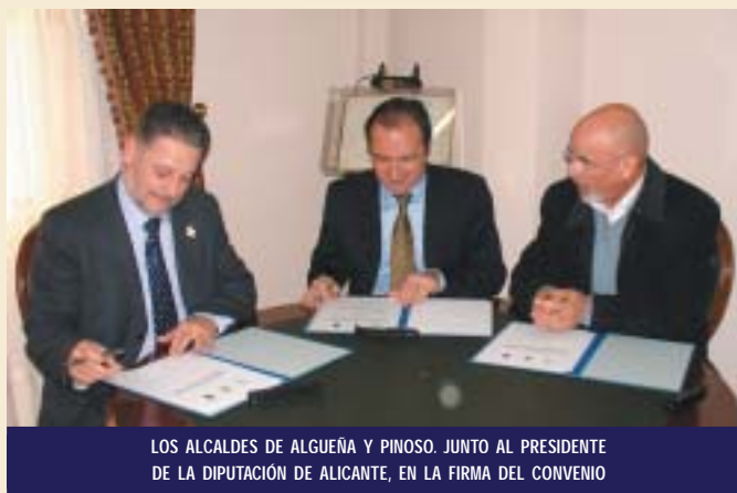
LOS ALCALDES DE ALGUEÑA Y PINOSO, JUNTO AL PRESIDENTE DE LA DIPUTACIÓN DE ALICANTE, EN LA FIRMA DEL CONVENIO

Durante este año deberá hacerse realidad el proyecto de reposición de redes de agua potable, alcantarillado y en-