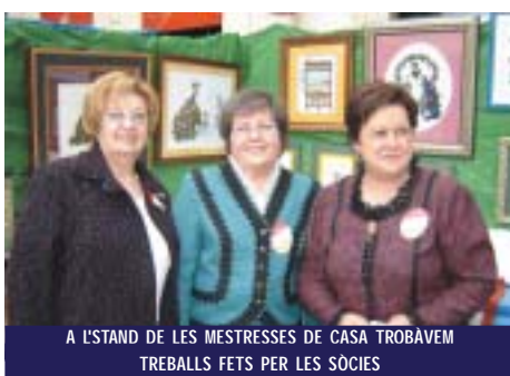
A L'STAND DE LES MESTRESSES DE CASA TROBAVEM TREBALLS FETS PER LES SÒCIES