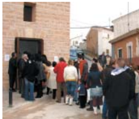
LLARGUES CUES PER A VISITAR LA MAQUINÀRIA DE LA TORRE DEL RELLOTGE