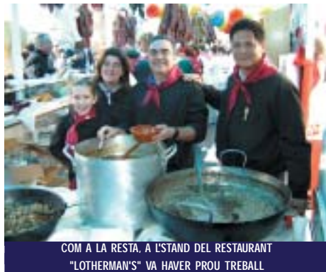
COM A LA RESTA, A L'STAND DEL RESTAURANT "LOTHERMAN'S" VA HAVER PROU TREBALL