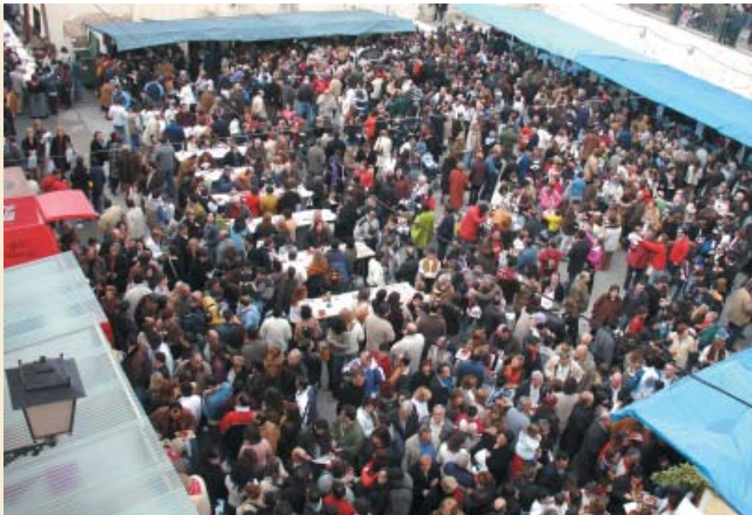
ASPECTE QUE PRESENTAVA EL PÀRQUING DE L'AJUNTAMENT EN LES HORES CENTRALS DE LA JORNADA

L'edició del Villazgo de 2006 ens deixa una agradable xifra que ens indica la gran quantitat de gent que va visitar el municipi. 20.000 degustacions, en poc més de tres hores, es van repartir per a tastar pastes, embotits, plats típics i vins de la terra. Tot acompanyat pel bon oratge.