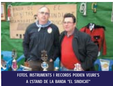
FOTOS, INSTRUMENTS I RECORDS PODIEN VEURE'S A L'STAND DE LA BANDA "EL SINDICAT"