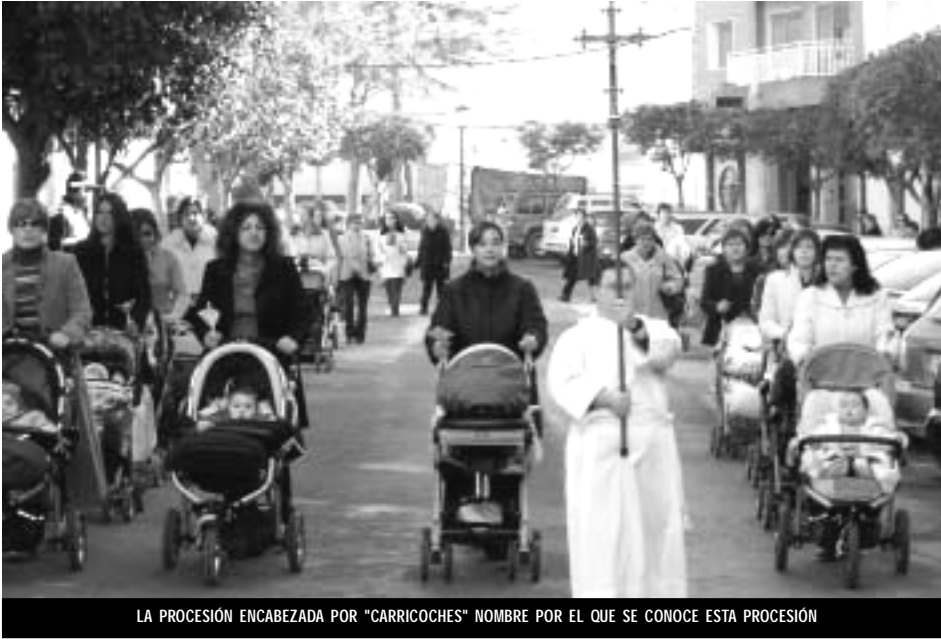
LA PROCESIÓN ENCABEZADA POR "CARRICOCHE" NOMBRE POR EL QUE SE CONOCE ESTA PROCESIÓN

Febrero nos trajo la festividad de la Candelaria (el día 2), que conmemora la presentación de Jesús en el Templo. Siguiendo esta tradición, muchos bebés nacidos en el último año participaron en la procesión de las candelas y, después de la misa, fueron presentados a la Patrona de Pinoso.