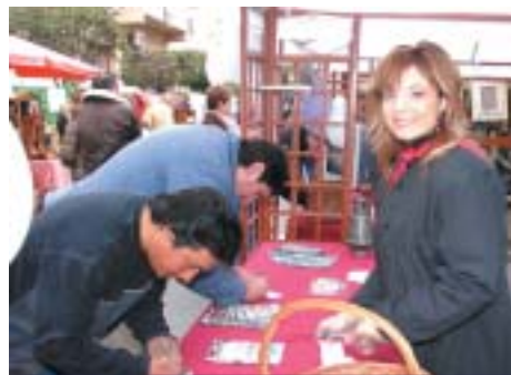
L'ACP VA FER UN SORTEIG ENTRE ELS QUE VAN VISITAR L' STAND