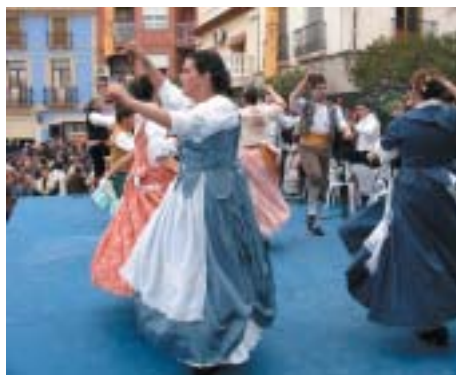
BALLADORES DE "MONTE DE LA SAL" EN PLENA ACTUACIÓ