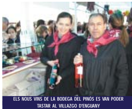
ELS NOUS VINS DE LA BODEGA DEL PINÓS ES VAN PODER TASTAR AL VILLAZGO D'ENGUANY