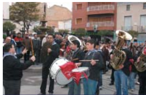
LA "UNIÓ LÍRICA" TAMPOC VA FALTAR ENGUANY