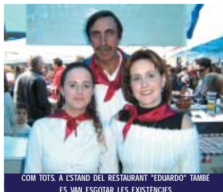
COM TOTS, A L'STAND DEL RESTAURANT "EDUARDO" TAMBÉ ES VAN ESGOTAR LES EXISTÈNCIES