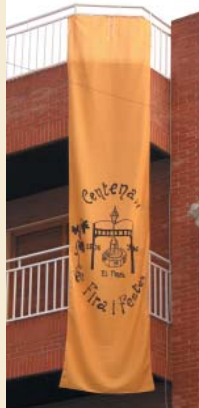
CARTELL DEL CENTENARI DE LA FIRA I FESTES

Es tracta d'un dibuix a ma alçada en el qual es representa l'inici de les nostres festes, amb el fanal que presidia la Plaça de l'Ajuntament fa 100 anys i el taulat, i amb la llegenda "Centenari Fira i Festes, El Pinós 1906 - 2006". Aquest logotip ha estat triat per la comissió creada per a preparar els actes commemoratius de l'efemèride, i el disseny és de Mari Sol Pérez. A partir d'ara, al llarg de tot l'any, el logotip estarà present a tots els esdeveniments que organitze el Consistori. Així mateix, es reproduirà als programes de diferents actes culturals, com la representació de la sarsuela "Un año de amor y sequía", que tindrà lloc els pròxims dies 11 y 12 de març, representada per l'Agrupació Rondalla-Coral "Monte de la Sal".