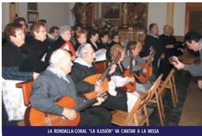
LA RONDALLA-CORAL "LA ILUSIÓN" VA CANTAR A LA MISSA