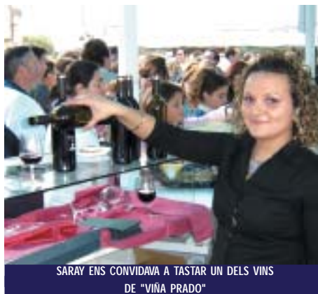
SARAY ENS CONVIDAVA A TASTAR UN DELS VINS DE "VIÑA PRADO"