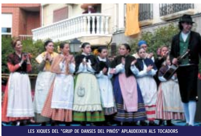
LES XIQUES DEL "GRUP DE DANSES DEL PINÓS" APLAUDEIXEN ALS TOCADORS