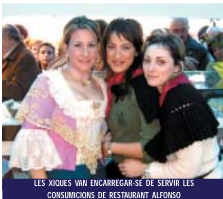
LES XIQUES VAN ENCARREGAR-SE DE SERVIR LES CONSUMIIONS DE RESTAURANT ALFONSO