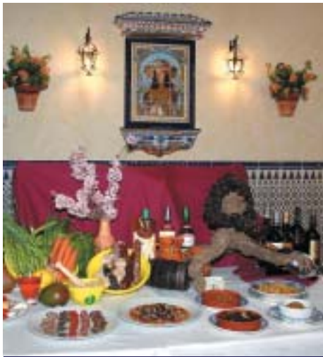
CADA RESTAURANTE ELABORÓ ENTRANTES TÍPICOS PINOSEROS JUNTO A LOS PLATOS MÁS TRADICIONALES