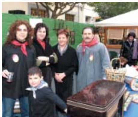
L'ASSOCIACIÓ DE VEÏNS DEL CULEBRÓN TAMPOC VA FALTAR A LA CITA