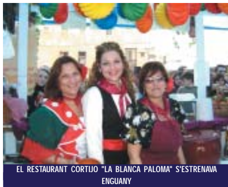
EL RESTAURANT CORTIJO "LA BLANCA PALOMA" S'ESTRENAVA ENGUANY