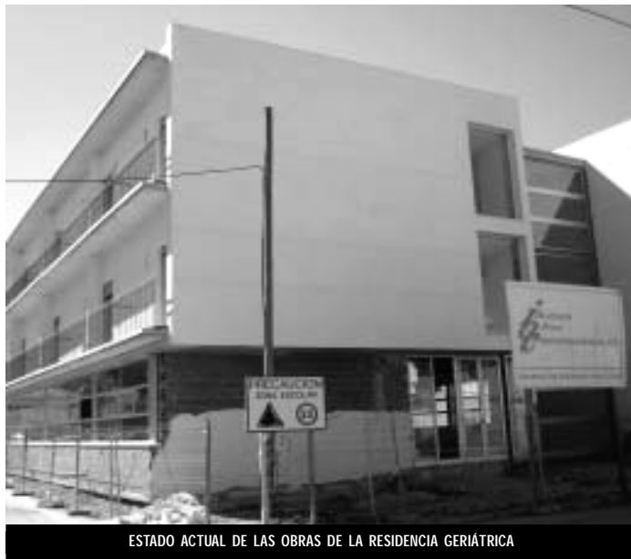
ESTADO ACTUAL DE LAS OBRAS DE LA RESIDENCIA GERIÁTRICA

En la misma junta de gobierno del 7 de febrero, se aprobó adjudicar, a la empresa Omega Urbacivil, las obras de construcción de los vestuarios del pabellón de Deportes "García Córdoba", por un importe de 111.000 euros, con un plazo de ejecución de tres meses y 15 días.