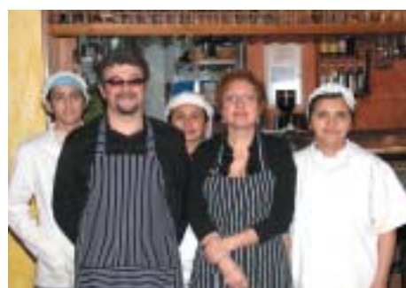
LA PLANTILLA DE RESTAURANTE "LA PEÑA" ANTES DE EMPEZAR A PREPARAR Y SERVIR MESSAS