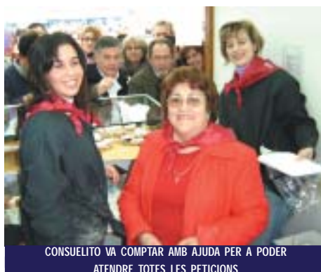
CONSUELITO VA COMPTAR AMB AJUDA PER A PODER ATENDRE TOTES LES PETICIONS