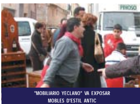
"MOBILIARI YECLANO" VA EXPOSAR MOBLES D'ESTIL ANTIC