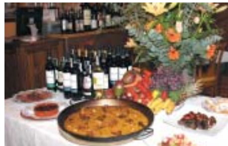
EL ARROZ CON CARACOLES ES SIN DUDA UNO DE LOS PLATOS MÁS APRECIADOS DE NUESTRA GASTRONOMÍA