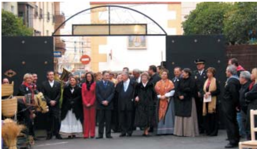
PASSEIG DE LES AUTORITATS PEL RECINTE DE LA MOSTRA