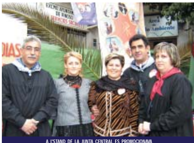
A L' STAND DE LA JUNTA CENTRAL ES PROMOCIONAVA EL 150 ANIVERSARI DE LA SETMANA SANTA