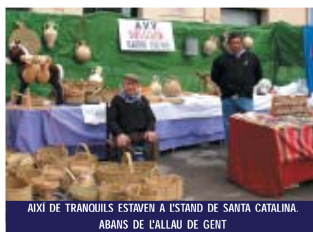
AIXÍ DE TRANQUILS ESTAVEN A L'STAND DE SANTA CATALINA. ABANS DE L'ALLAU DE GENT