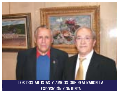
LOS DOS ARTISTAS Y AMIGOS QUE REALIZARON LA EXPOSICIÓN CONJUNTA