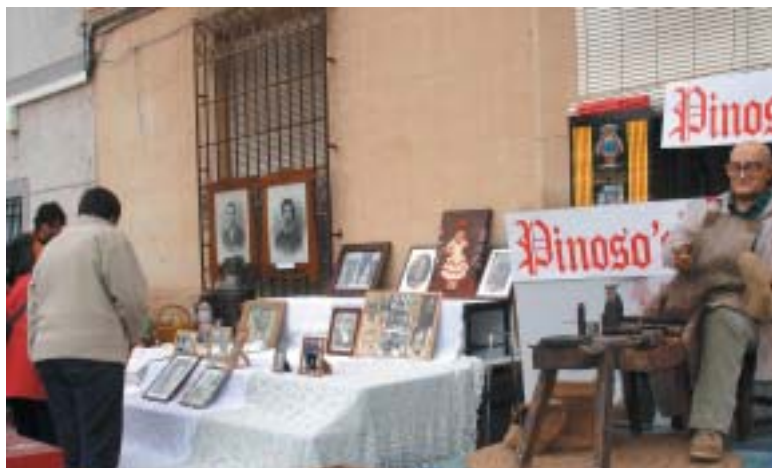
JUNTAMENT A L' STAND DELS NOSTRES MAJORS, ES PODIEN ADQUIRIR SABATES DE "PINOSO'S"