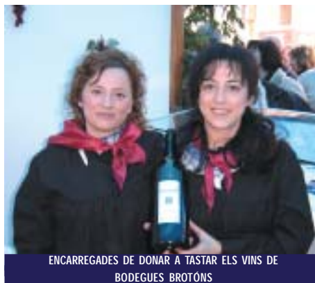
ENCARREGADES DE DONAR A TASTAR ELS VINS DE BODEGUES BROTONS