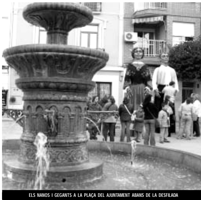
ELS NANOS I GEGANTS A LA PLAÇA DEL AJUNTAMENT ABANS DE LA DESFILADA

En fer-se de nit, més de 60 dimonis y 2.500 cohets es van fer els amos dels diferents carrers del poble, en l'anomenat Correfocs, que cada any guanya més seguidors, acabant al parking de l'Ajuntament amb un castellet.