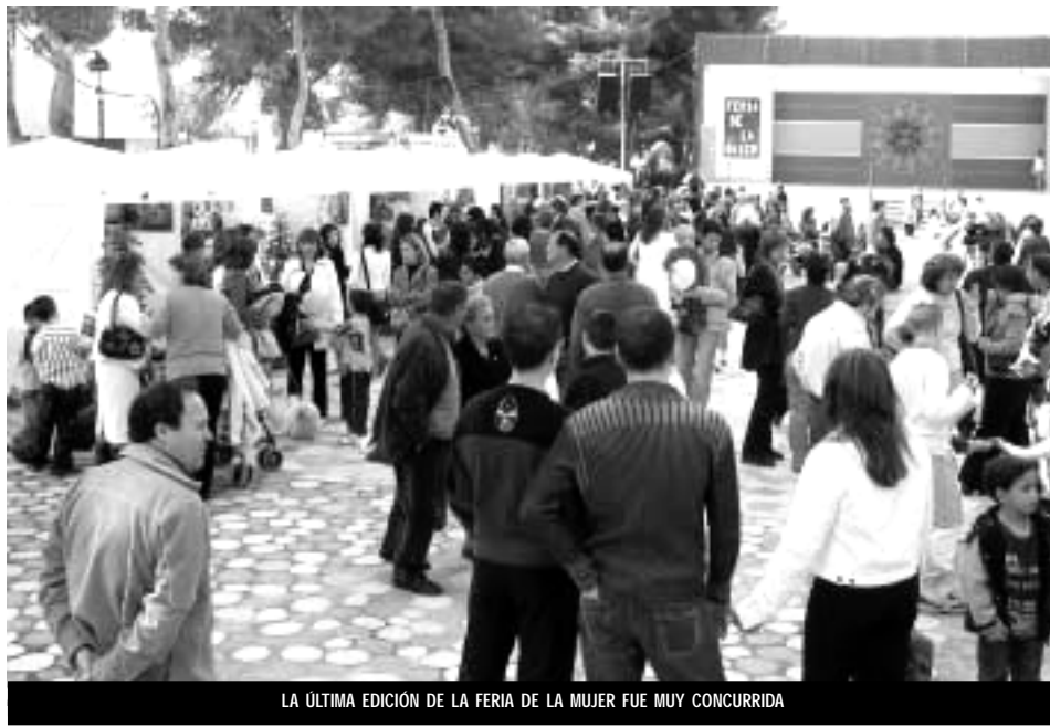
LA ÚLTIMA EDICIÓN DE LA FERIA DE LA MUJER FUE MUY CONCURRIDA

La Concejalía de la Mujer aprovechó los actos del Villazgo para presentar la V edición de la Feria de la Mujer Empresaria y Emprendedora, que tendrá lugar el próximo 12 de marzo.