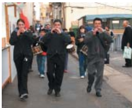
LA MÚSICA DE DOLÇAINA I EL TABAL VA DESPERTAR EL VEÏNAT