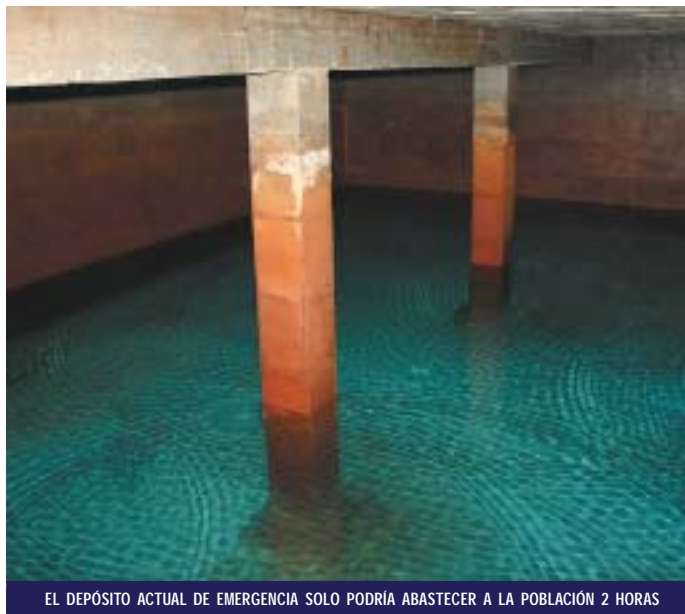
EL DEPÓSITO ACTUAL DE EMERGENCIA SOLO PODRÍA ABASTECER A LA POBLACIÓN 2 HORAS

Ambos organismos subvencionarán el 90% de esta obra, y el Consistorio habrá de afrontar el 10% del coste definitivo de la actuación, cuyo presupuesto inicial, y según el documento técnico redactado, es de 1.027.583 euros.