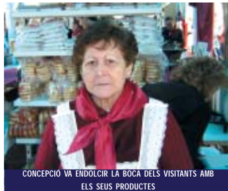
CONCEPCIÓ VA ENDOLCIR LA BOCA DELS VISITANTS AMB ELS SEUS PRODUCTES