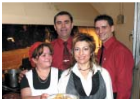
EN RESTAURANTE ENCEBRAS "ELS ALLS I PICAT" SON UNO DE LOS PLATOS MÁS SABROSOS Y DEMANDADOS POR SUS CLIENTES