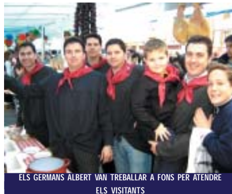
ELS GERMANS ALBERT VAN TREBALLAR A FONTS PER ATENDRE ELS VISITANTS