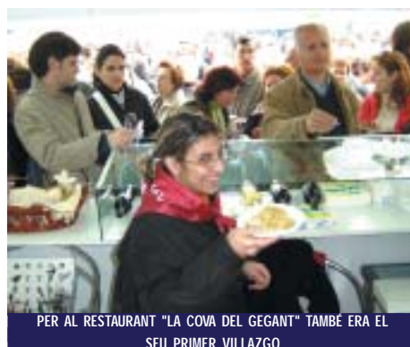
PER AL RESTAURANT "LA COVA DEL GEGANT" TAMBÉ ERA EL SEU PRIMER VILLAZGO