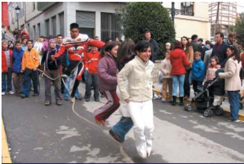
DAVANT L'ESGLÉSIA, ELS MÉS XIQUETS VAN TENIR EL SEU RACÓ DE JOCS