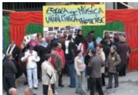
VISTA DE L'STAND DE LA SOCIETAT "UNIÓN LÍRICA"