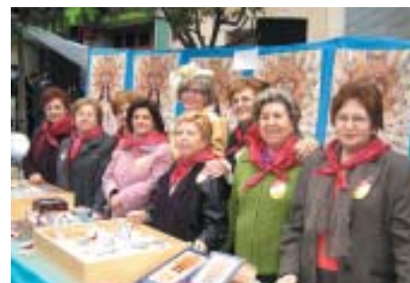
MEMBRES DE LA DIRECTIVA DE LA CONFRARIA VERGE DEL REMEI, AL SEU STAND