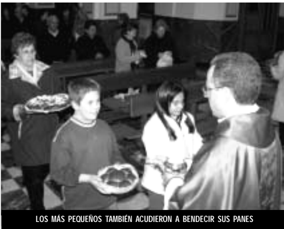
LOS MÁS PEQUEÑOS TAMBIÉN ACUDIERON A BENDECIR SUS PANES

El 3 de febrero, día de San Blas (abogado de los males de garganta), se llevó a cabo la popular bendición de los panes del santo. Muchos de ellos los habían elaborado pinoseros fieles a esta tradición, pero también varias panaderías ofrecieron a sus clientes estos panes, que se asemejan a las toñas en su aspecto exterior, pero que nada tienen que ver con ellas.