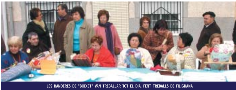
LES RANDERES DE "BOIXET" VAN TREBALLAR TOT EL DIA, FENT TREBALLS DE FILIGRANA