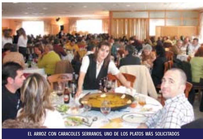
EL ARROZ CON CARACOLES SERRANOS, UNO DE LOS PLATOS MÁS SOLICITADOS