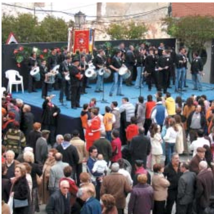
LA BANDA DE CORNETES I TAMBORS "EL SINDICAT", ACTUANT A L'ESCENARI

Després de dinar, per la vesprada, i com sempre, els ritmes de "Tres fan Ball" van fer suar la gota gorda als que van aguantar fins l'últim moment del Villazgo d'enguany.