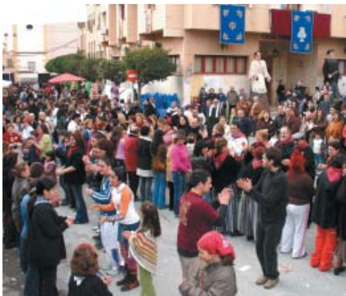
LA MÚSICA DE "TRES FAN BALL" VA FER DANSAR A TOTS