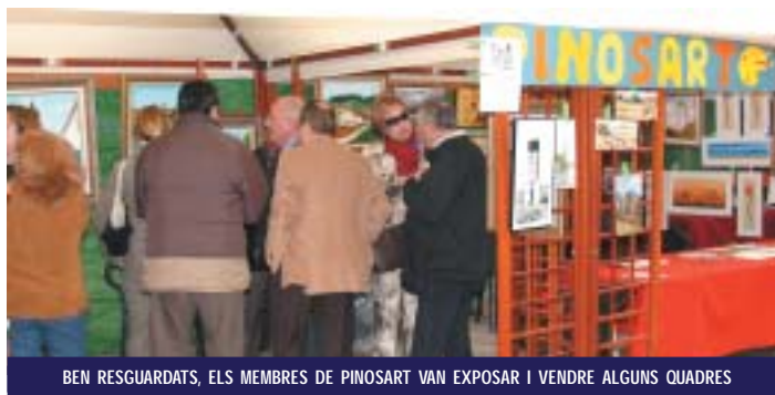
BEN RESGUARDATS, ELS MEMBRES DE PINOSART VAN EXPOSAR I VENDRE ALGUNS QUADRES