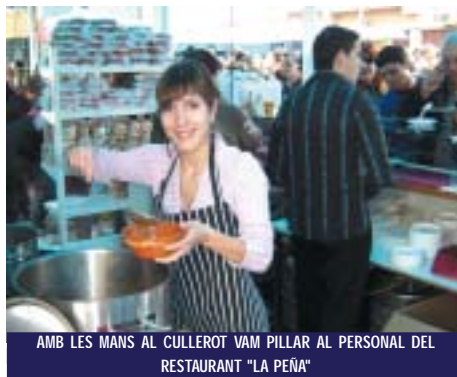
AMB LES MANS AL CULLEROT VAM PILLAR AL PERSONAL DEL RESTAURANT "LA PEÑA"