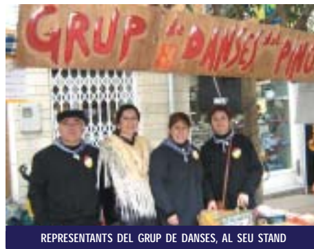
REPRESENTANTS DEL GRUP DE DANSES, AL SEU STAND