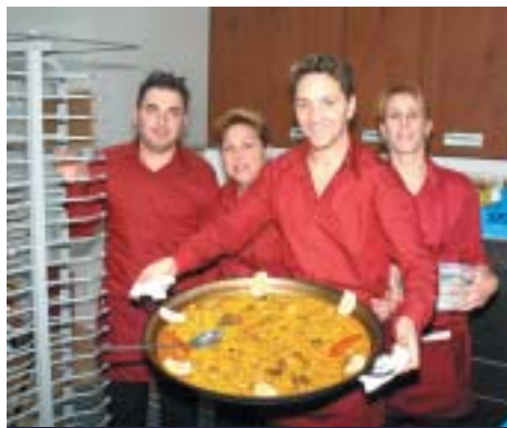
BUEN COMIENZO PARA "CORTIJO LA BLANCA PALOMA" QUE SE ESTRENÓ EN LA MOSTRA