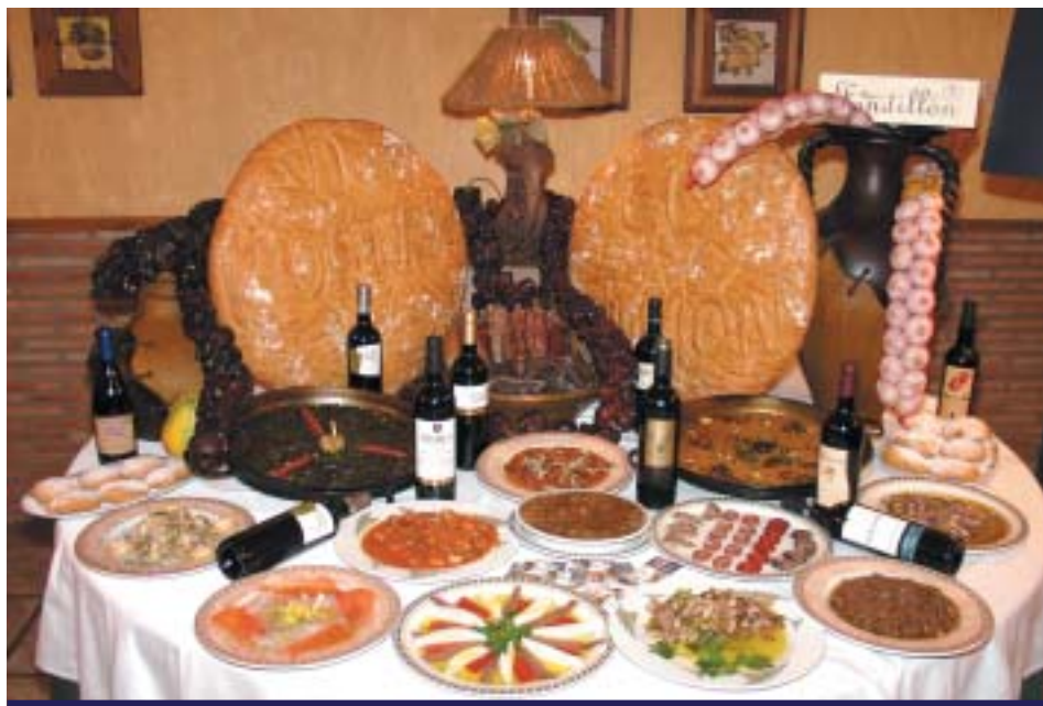
MAGNIFICO BODEGÓN EL QUE NOS PRESENTÓ "EL TIMÓN" CON ENTRANTES Y PLATOS PRINCIPALES

Para comenzar, en la primera jornada de la Mostra se sirvió un menú que tenía como plato principal la gachami-ga, y que estuvo precedido por diferentes entrantes, entre los cuales, la pipirrana y el embutido seco repetirían durante toda la semana. Los siguientes menús estarían protagonizados por platos tan pinoseros como les "fasse-gures", els "alls i picat", los gazpachos o el arroz con conejo y caracoles. Y para cerrar el menú del día, cada restaurante