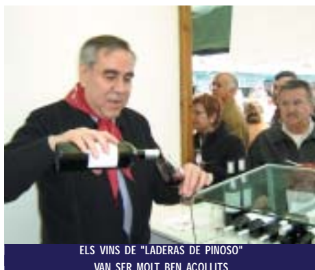
ELS VINS DE "LADERAS DE PINOSO" VAN SER MOLT BEN ACOLLITS