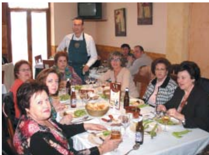
UN GRUPO DE AMIGAS DISFRUTÓ PARTE DE UN PREMIO DE LOTERÍA ACUDIENDO A UNA JORNADA CULINARIA