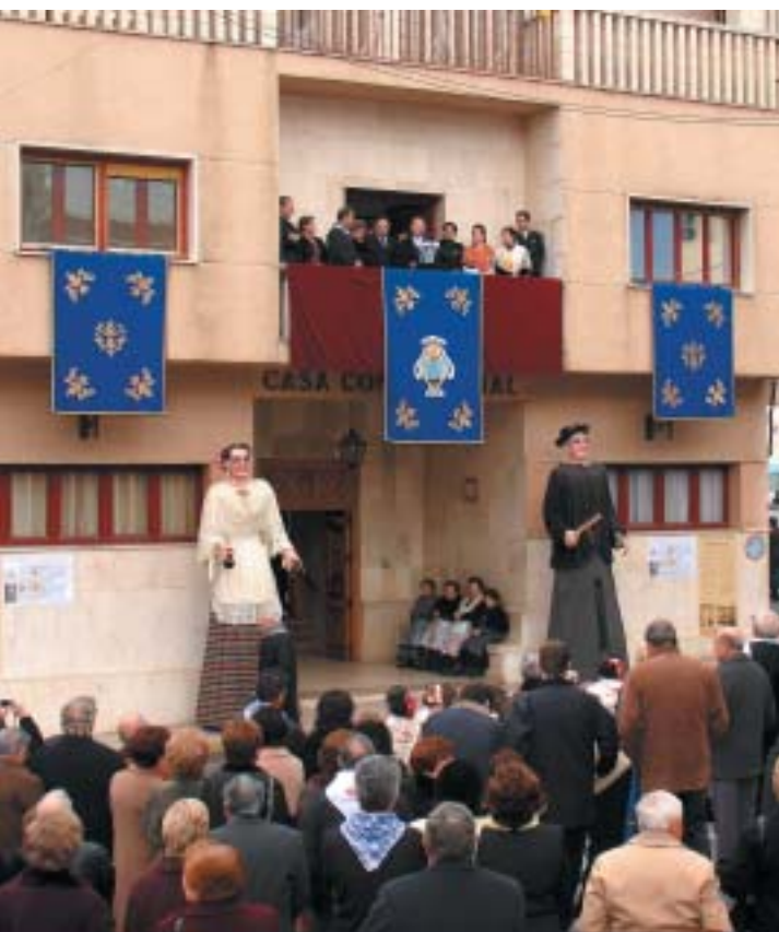
ASPECTE DE LA PLAÇA DE L'AJUNTAMENT DURANT EL PREGÓ