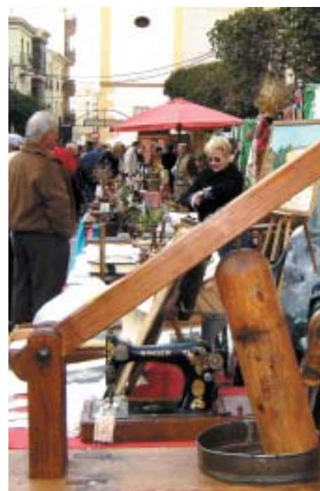
A L'STAND DE LES PEDANIES UNA MÀQUINA D'ACAPOLAR

sones que recordaven tenir-ne alguna igual o que en col·leccionaven.