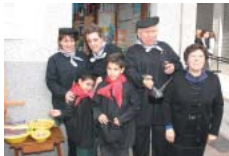
JUANJO TAMBÉ ES VA UNIR A LA FESTA